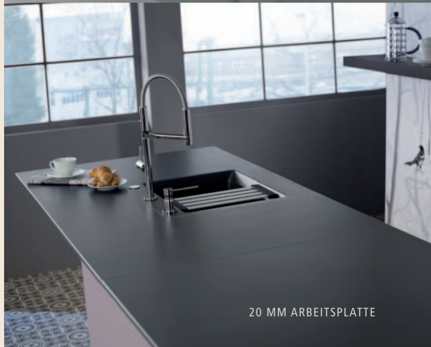
20 MM ARBEITSPLATTE

KeraDomo VOLLKERAMISCHE ARBEITSPLATTEN / TISCH- und BARPLATTEN