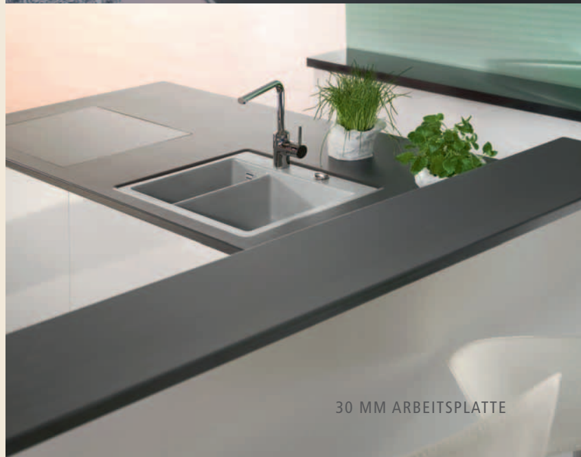
30 MM ARBEITSPLATTE