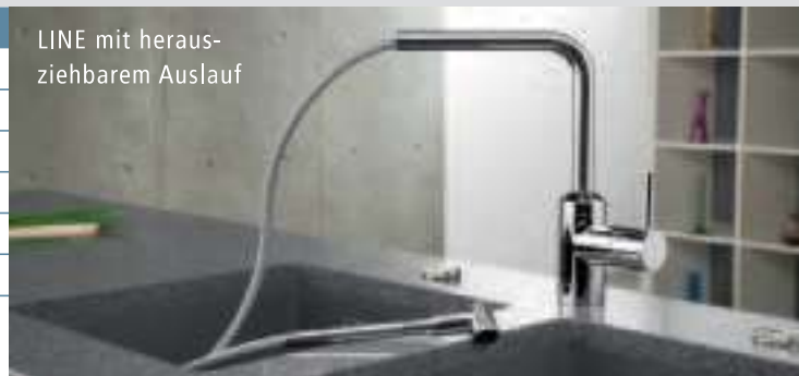
LINE mit herausziehbarem Auslauf